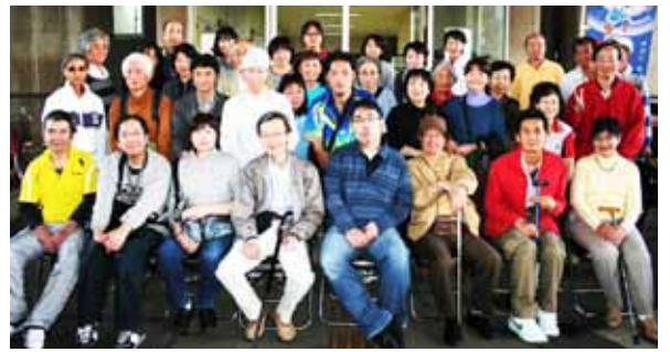
参加者：レインボーさん16名、ドリーム27名。計43名

10月26日（金曜・PM1：00～5：00）、市内で高次脳機能障がい者の自主グループとして活動されている「東京レインボー倶楽部」と、卓球交流会を行いました。午前の一部プログラムで、段ボール・色紙・リボンテープを使って、金・銀・銅のメダルを作りました。