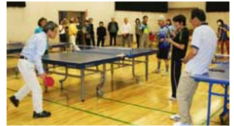
熱戦が続いた試合

レインボー倶楽部との卓球交流大会が、西調布体育館でありました。広い体育館でトーナメント制の試合が出来、とても満足でした。結果は、私が優勝！ 参加者の皆さん楽しい時間を過ごせたようです。次回の開催が楽しみです。