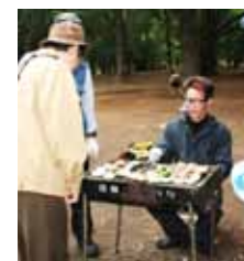
おいしく焼けたよ♪