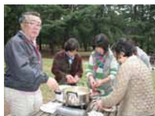
味噌汁は僕にお任せ！