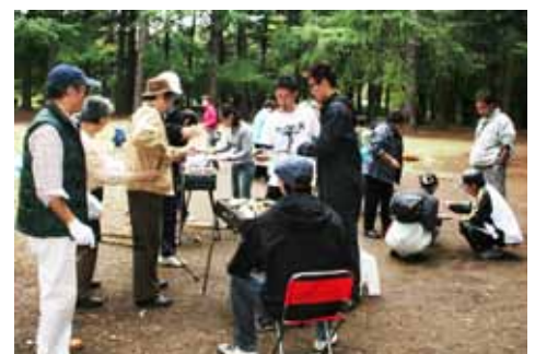
参加者：トレイニー12名、家族7名、ボランティア6名、職員6名。計31名

10月30日（火）、6月に計画されて以来お天気に恵まれずに延期になっていたバーベキュー大会が、ついに実現しました。当日は曇りでしたが風もなく穏やかな一日でした。次々焼かれるお肉や野菜に「もうお腹一杯！」と言いながらも、最後の焼きそばまで頑張っていました。食後はキャッチボールやバドミントン、ボールを使った『しりとりゲーム』などを楽しむ人あり、気持ちよさそうにお昼寝を決め込む人もあり、それぞれリラックスした時間を過ごしました。