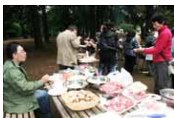
食べるものがいっぱい☆嬉しいね